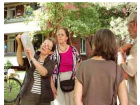
Stadtspaziergang durch „Neu-Eimsbüttel“, 2014, Foto: Andrea Orth