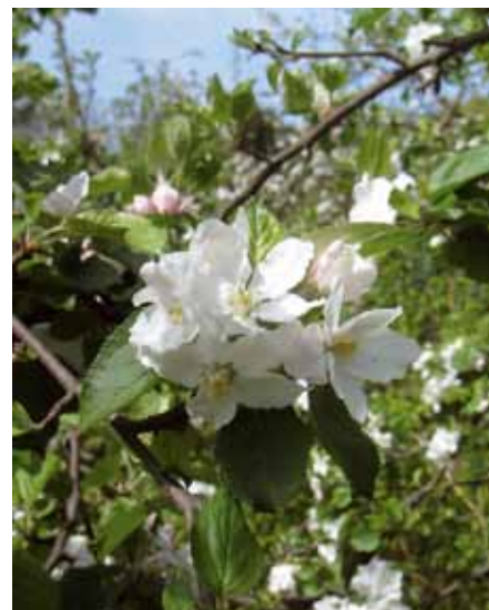
Freuen Sie sich auf blühende Obstbäume bei unserem Ausflug im April

Alle Ausflüge finden an einem Mittwoch tagsüber statt und kosten 10 € pro Person. Im Preis inbegriffen sind Busfahrt, Eintrittspreis und Kaffee & Kuchen. Die Ausflüge starten und enden vor dem Bürgertreff in der Gefionstr. 3. Anmeldung im Bürgertreff Altona-Nord, Tel. 42 10 26 81. Die Seniorenausflüge werden gefördert aus Mitteln des Bezirksamtes Altona.