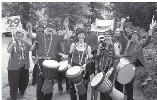
Hoffentlich dabei: Rythmusgruppe Klopfen & Klöttern

im Bäckerladen, beim Frisör oder im Restaurant, ob auf dem Balkon, an der Bushaltestelle oder im Hinterhof, fast alles ist möglich. Vielleicht sogar in Ihrem Wohnzimmer, falls Sie Lust haben, Ihre Nachbarn zu einem kleinen Kammerkonzert einzuladen.