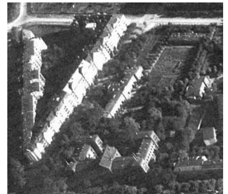
Der Lazarettgelände in den 20er Jahren: im Süden das Hauptgebäude, im Norden der heutige Bürgertreff, im Westen an der Alsenstraße das Moritz-Liepmann-Haus.

beeten sind bei den Soldaten beliebte Motive für die Heimatpost. Zu Beginn der Weimarer Republik wird das Militärhospital geschlossen. Der Park bleibt erhalten und wird weiter gepflegt, die Gebäude werden jetzt, u.a. vom Finanzamt, als Verwaltungsgebäude genutzt. Nach dem 2. Weltkrieg wird die Grünanlage zu Schrebergärten umgepflegt. Lebensmittel sind knapp, man pflanzt Obstbäume und zieht Gemüse, um den kargen Speiseplan aufzubessern.