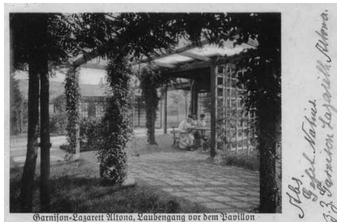
Garnison-Lazarett Altona, Laubengang vor dem Pavillon

gesät. Bäume und Büsche werden hier nicht gepflanzt, nur einige neue Rosenbeete entstehen, wie wir aus dem damaligen Inspektionsbericht erfahren – wir befinden uns in der Aufrüstungsphase des Kaiserreiches, der Platz soll zum schnellen Bau eventuell gebrauchter Notbaracken freigehalten werden. Postkarten mit Impressionen vom Laubengang und den Stauden-