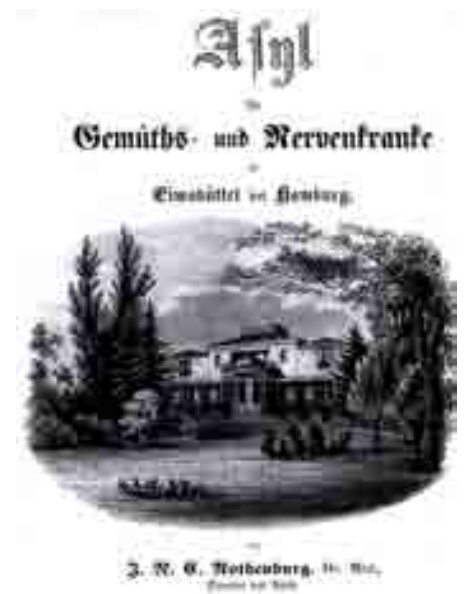
Dr. Rothenburgs Werbebroschüre von 1852: Asyl in Parklandschaft .

Kranken zuträglich Lage, „welche noch nicht von dem Gedränge des Stadtlebens oder dem Geräusch und Dunst der Fabriken und Dampfmaschinen berührt worden ist.“ Und er warb auch damit, dass Hamburgs Umlande bekannt und beliebt seien „wegen ihrer Großartigkeit und Lieblichkeit“. Auch wenn er dann großmütig zugibt, das „die erstere“, nämlich die Großartigkeit in Eimsbüttel doch