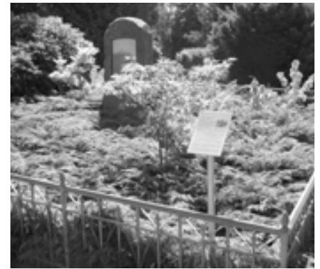
Das Grab heute. Ein schlichter Stein ersetzt das zerstörte alte Grabdenkmal.

Stuhlmannbrunnen auf dem Platz der Republik erinnern? Günther Ludwig Stuhlmann, 1797 als zweites Kind des Kammerrathes Casper Hinrich Stuhlmann in Ottensen-Neumühlen geboren, war zu Lebzeiten beruflich sehr erfolgreich und zum Wohle Altonas tätig. Er reiste viel und erwarb sich als Autodidakt große technische Kenntnisse auf dem Gebiet der Gas- und Wasserversorgung. 1844 baute er in Kopenhagen zur Erleuchtung des Casinos eine Gasanstalt, die er neun Jahre lang leitete. Er genoss das Vertrauen des dänischen Königs, der ihn