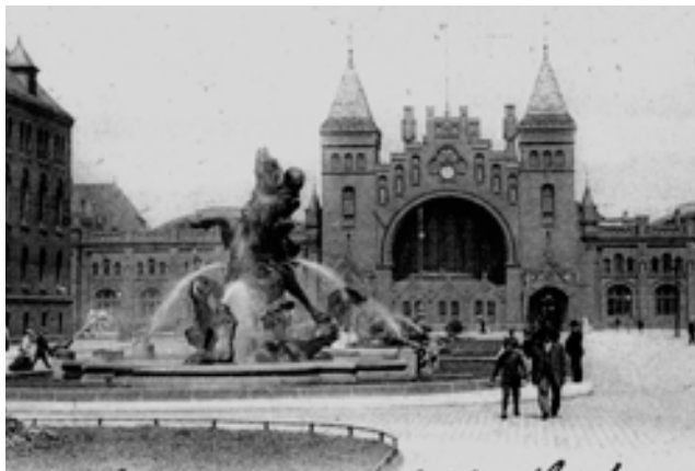
Der Stuhlmannbrunnen um 1900 vor dem Altonaer Bahnhof.

Das große Ehrengrab wurde mit einem schmiedeeisernen Gitter umgeben. In der Mitte erhob sich, aus Sandsteintrümmern herausragend, ein großer, glatter Sandstein. Ein sitzender Todesengel bekrönte den Sockel - in der linken Hand eine Trompete, den Arm auf eine abgebrochene Säule gestützt. Die rechte Hand ruhte auf der Brust der Grabplastik. Dieses monumentale Grabdenkmal ist leider nicht erhalten. 1956 erhielt das Grab einen neuen, schlichten Gedenkstein. Wer war dieser Mann, an den heute, neben seinem Grab, nur noch eine kleine Straße in Altona-Altstadt und der von ihm gestiftete