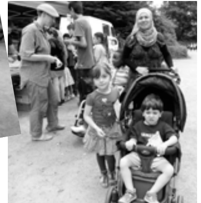
Ob Rollstuhl oder Kinderkarre: Dabei sein war alles.