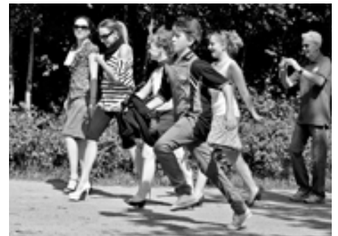
Stöckelschuhlauf: Immerhin 4 Damen trauten sich.