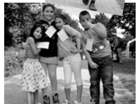
Kleine Pause für den Fotografen.