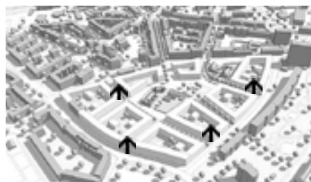
Das Bild re. zeigt das Gelände heute, der Pfeil markiert die Kurt-Tucholsky-Schule. Bild li.: So könnte es in 20 Jahren aussehen. Die Pfeile markieren mögliche Neubauten.

Stadtteil Mitte-Altona umziehen soll, gibt es umfangreiche Pläne. Die Flächen der Kita, des Bauspielplatzes und der Kleingärten wurden dabei ebenfalls planerisch für eine mögliche Wohnungsbebauung ins Auge genommen. Große Pläne für unseren Stadtteil, die aber noch nicht in Beton gegossen sind, sondern im Dialog mit der Bevölkerung entwickelt