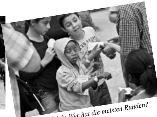
Großer Vergleich: Wer hat die meisten Runden?