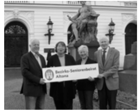
Seniorenbeirat lädt ein zur Elbfahrt