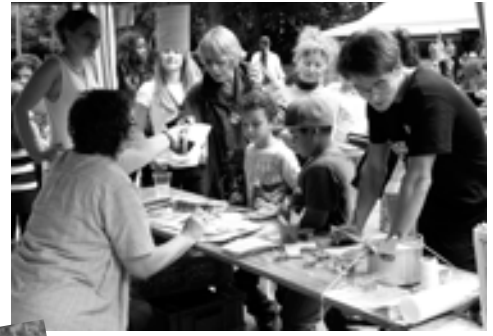
Großes Gedränge bei der Anmeldung.

Ein bisschen Sorge hatten wir schon: Wenig Anmeldungen für den Spendenlauf und seit Tagen Regenwetter! Umso größer war die Freude, als dann am 11. August die Sonne raus kam und 100 Läufer an den Start gingen.