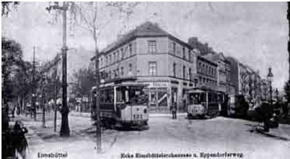
Um 1900 ist das Parkgelände dicht bebaut, die Rothenburgsche Klinik längst abgerissen. Große Mietshäuser säumen Eppendorfer Weg und Eimsbütteler Chaussee.